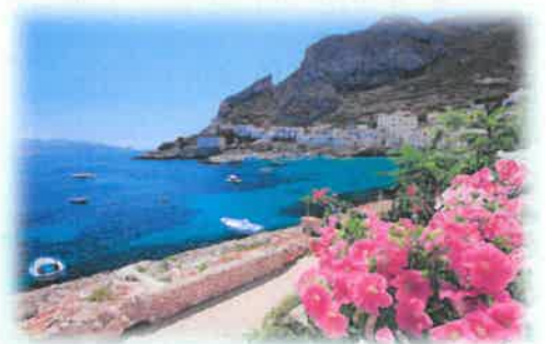
Isola di Levanzo, Sicilia