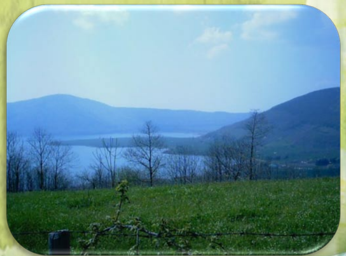
Il Lago Vico

Oggi, Caprarola è famosa per la cucina e il paesaggio fantastico.