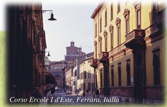
Corso Ercole I d'Este, Ferrara, Italia

La mia esperienza è stata fantastica, ma ottenere il permesso di lavoro in Italia è FASTIDIOSISSIMO!! Vale la pena, ma ci vuole tanto tempo e tanta pazienza. La cosa più importante è trovare la famiglia giusta.