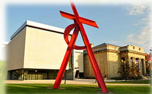
Il Museo d'Arte "UMMA"

Il sabato, mi alzerò presto, e pulirò la mia casa. Telefonerò a mia madre mentre farò la colazione. Poi andrò in palestra con due amici. Giocheremo a pallacanestro, giocheremo a ping pong e faremo ciclismo. Pranzheremo a mezzogiorno al mio ristorante giapponese preferito, Sadako.