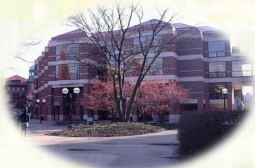
Shapiro Undergrad Library "UgLi"

Poi, frequento le lezioni. Porto un'agenda, un computer, molti libri, e molti quaderni nello zaino. La mattina è lunga e antipatica. M'incontro con un'amica e così cominciamo.